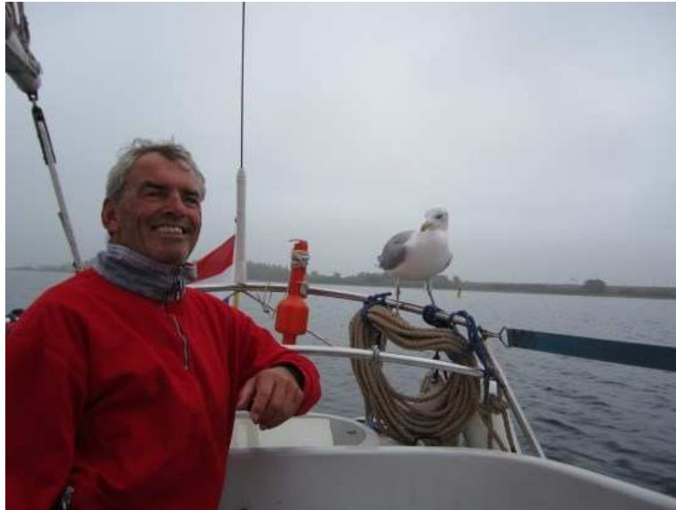
>Ook vóór de sluis van Bru trok de Sfæren al veel bekijks<