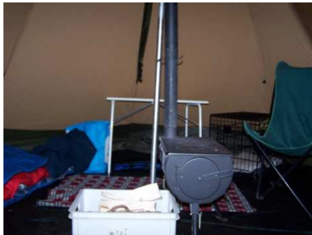
> De scheepskok op afstand met Tipi en houtkachel voor de heerlijkste stampotten <

En vervolgens kon er van 10.00 tot 22.00 dagelijks een bestelling voedsel afgeleverd worden, of zo vaak als nodig inclusief hete dranken, benzine en wat al niet meer noodzakelijk mocht zijn.