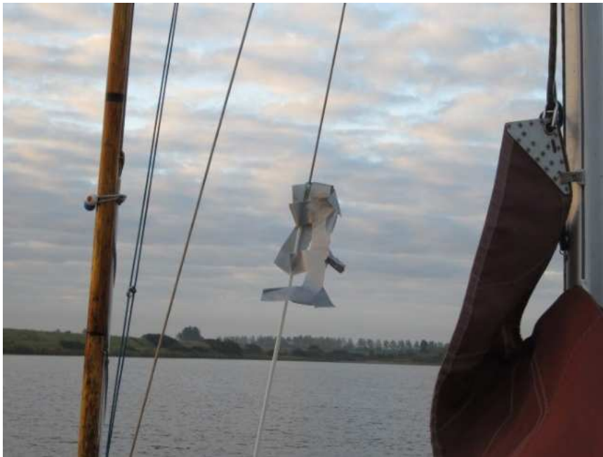
>Ductape-kunst in de verstaging, zowel BB als SB waargenomen<