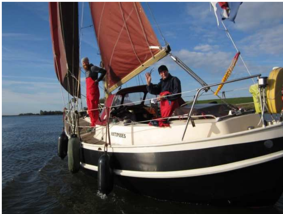
>De Antipodes onder zeil<

Prachtige beelden bij Tholen van collega spitsgatters en bruine zeilen. En dan de meesterzet! Sfæren past met haar 9,80 meter hoge mast, onder de 9,80 meter hoge bruggen over het Schelde-Rijnkanaal door. Met die weinige wind is het goed benzine stoken.