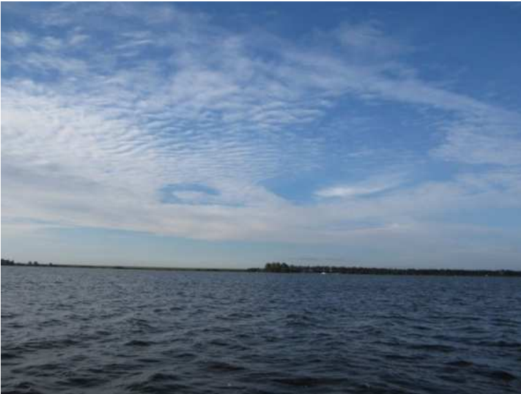
>Het gelijk of ongelijk van zeepaardjes in de lucht<