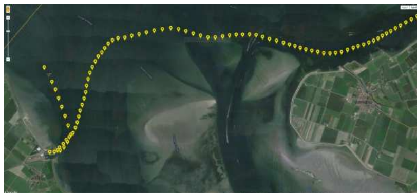
>Van Stavenisse naar Kats<

Zonder digitale kaart en dus geheel op kompascoers wordt de snelste lijn van rede van Stavenisse naar Kats door het donker gepriemd, vlak boven de platen langs van Vondelingsplaat.