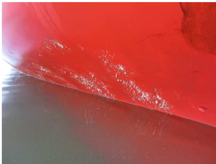
>De Sfæren, met Inna solo, drooggevallen op de Roggenplaat om Sal z'n pokken te verwijderen<

Op weg van Burghsluis naar Vlissingen wordt de Sfæren drooggelegd op de Roggenplaat. De avond bij laag water over SB en bij het volgend laag water in de ochtend, op de BB zijde,