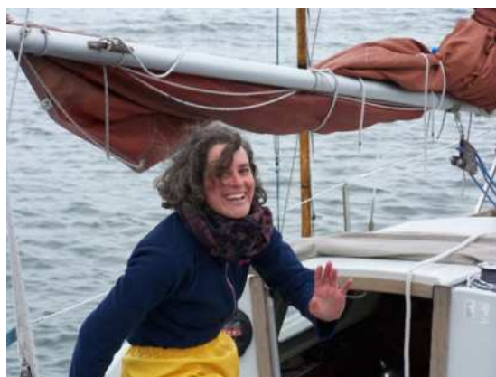
>...Ik ga zo onder zeil...<