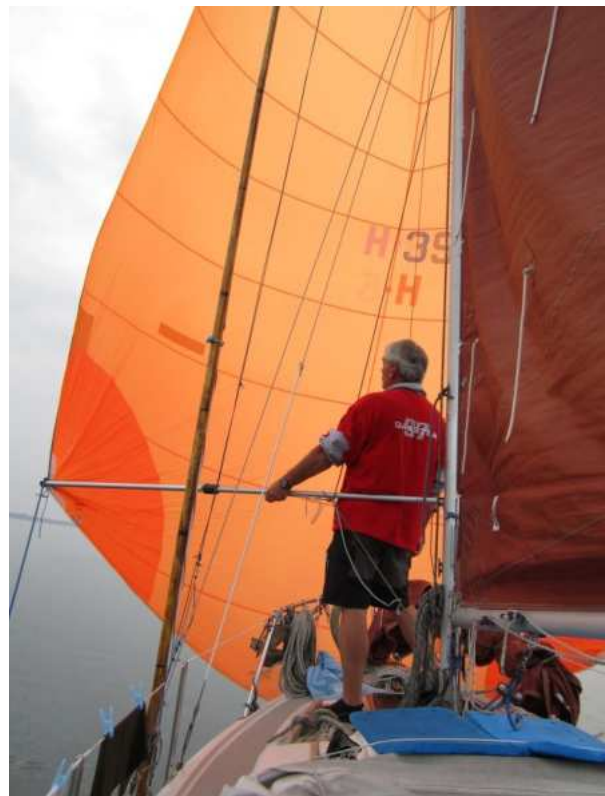
>Geheim wapen in de Krabbenkreek<