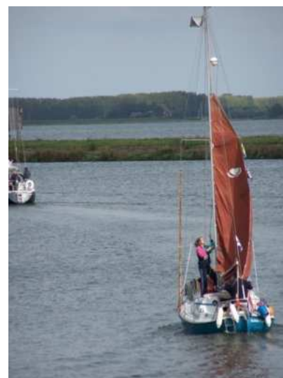
>Nautisch planningsmoment voor de schutting...en weer op weg, het Volkerak achter ons latend<