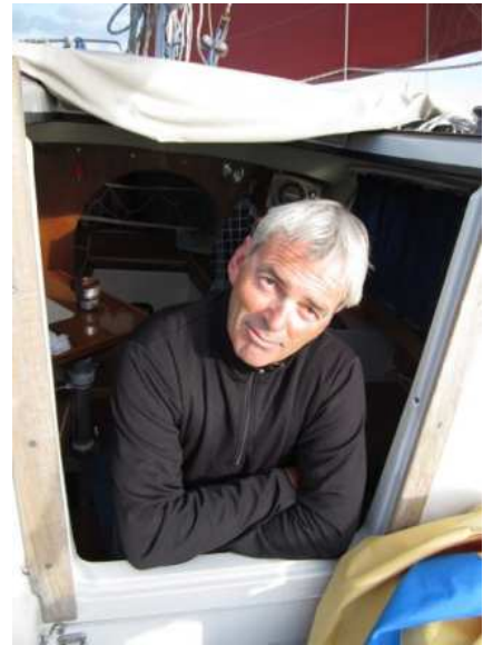
>Zeepaardjes Inna .....??<