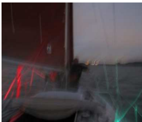
>Op de Oude Maas<