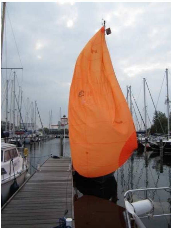
>Geheim wapen in testomgeving<