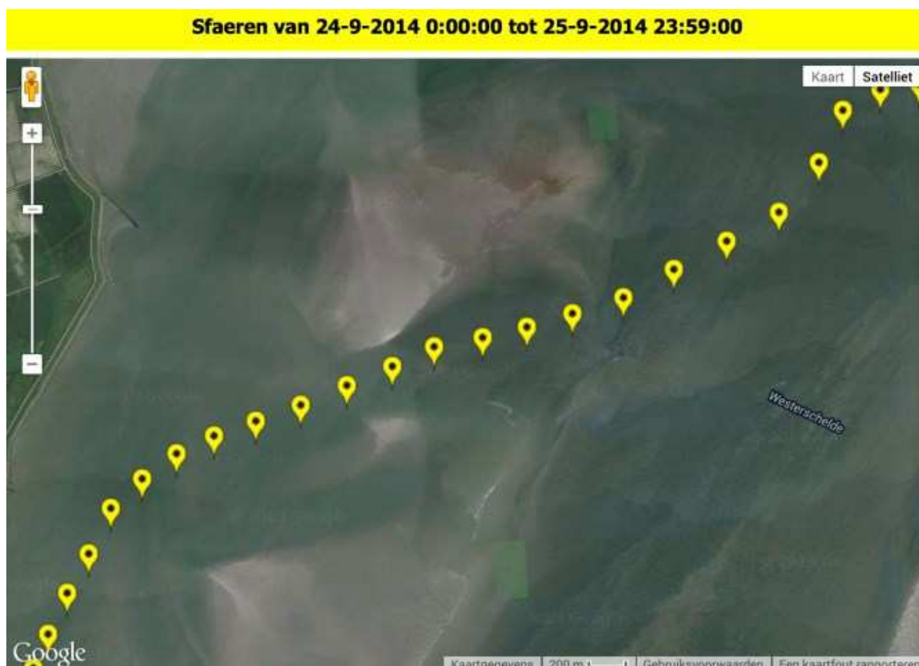
>Sfaeren door het Molengaatje<