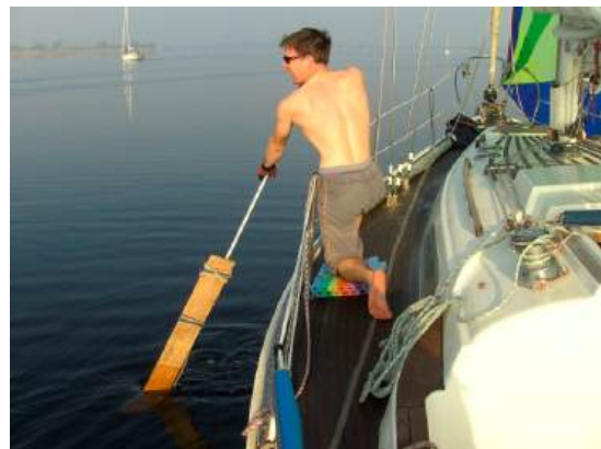
Geen wind: roeien!

Tot aan de Zeelandbrug ging het lekker, maar daarna liet de wind het echt afweten. Het lukte ons om zonder vaart de Zandkreek in te spoelen, maar op het Veerse Meer is er geen stroom meer die je vooruit helpt. Dan maar roeien. Van een paar pikhaken en planken fabriceerden we peddels, zodat we de afstand Zandkreeksluis-Wolphaartsdijk in een uur of twee konden volbrengen. Het leverde ons meewarige blikken van menig medewater-sporter op.